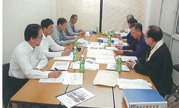
再建委員会会議の様子