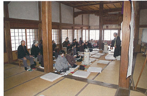
萬國寺本堂での法要