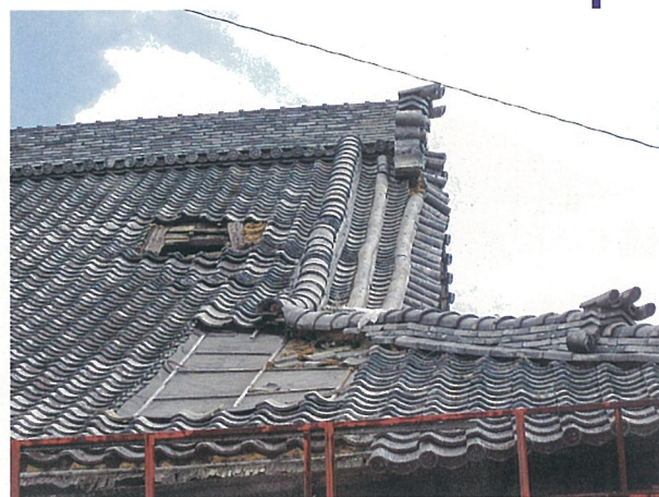
本堂屋根が大きく破損